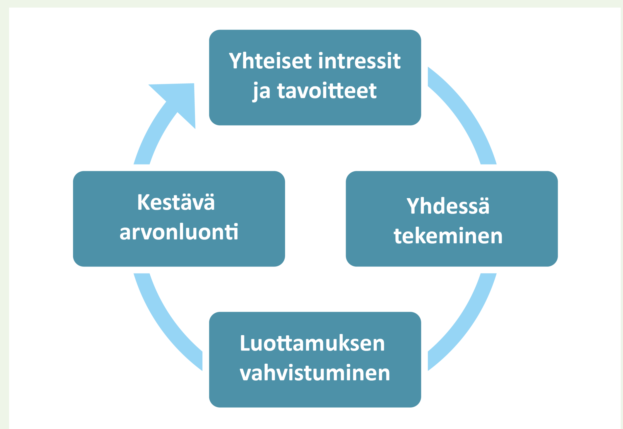
Kuvio 1. Sidosryhmäyhteistyön kehä (Kujala ym., 2019)

CICAT2025-konsortiossa kiertotalouden keskeisiksi sidosryhmiksi on tunnustettu yritykset, ministeriöt, keskusjärjestöt, tutkimus-, kehitys- ja tukiorganisaatiot, alueelliset toimijat sekä kunnat ja kaupungit. Sidosryhmien yhteinen tahtotila mahdollistaa yhdessä tekemisen, luottamuksen vahvistumisen ja kestävä arvonluonnin (Kuvio 1).