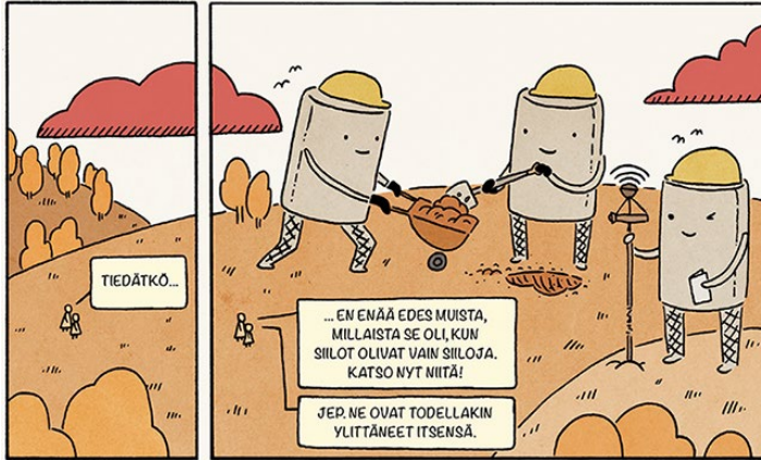
Kuva 1: Hankkeemme ensimmäisessä politiikkasuosituksessa todettiin, että Suomen tavoite olla kiertotalouden johtava maa vuoteen 2025 mennessä vaatii kaikilta kiertotalouden keskeisiltä sidosryhmiltä aktiivisia tekoja.

että yhteistyö uudistaa sidosryhmien ajatuksia kiertotaloudesta samalla, kun se auttaa tutkimusta pitämään yllä suunnan, jolla on poliittista vaikuttavuutta.